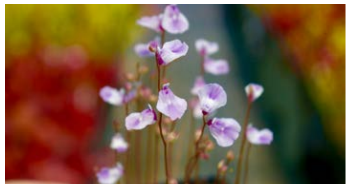
Utricularia livida Fleur Bleue