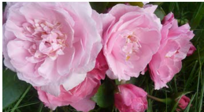
Rose de Bagnoles de l'Orne

Rose de Bagnoles de l'Orne peut être obtenue auprès des pépinières - présentes à Entre Ville et Jardin - au prix de 18,50 euros.