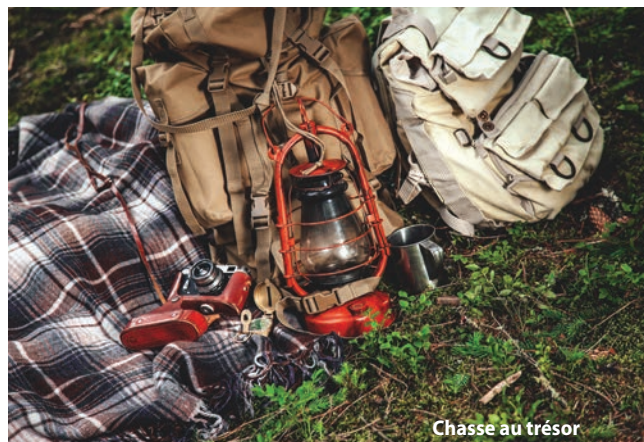
Chasse au trésor