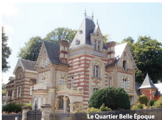
Le Quartier Belle Époque

Un second auditorium de 300 places et une série d'équipements hôteliers viennent compléter cette offre variée de salles de tous types et de toutes tailles.